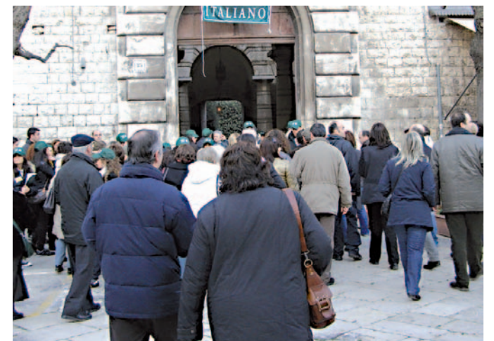
Corato, visitatori a Palazzo Gioia

● «Meravigliosi». «Incredibili». «Un vero peccato che simili tesori rimangono spesso chiusi a chiave». Sono alcuni commenti «scippati» ai visitatori che ieri e sabato hanno affollato i nobili palazzi «De Mattis», «Catalano» e «Gioia» a Corato, la grotta di San Michele e la lama «Matitani» a Minervino. Due città che, in occasione della sedicesima «Giornata Fai di primavera», sono state prese d'assalto da più di duemila affascinati visitatori.