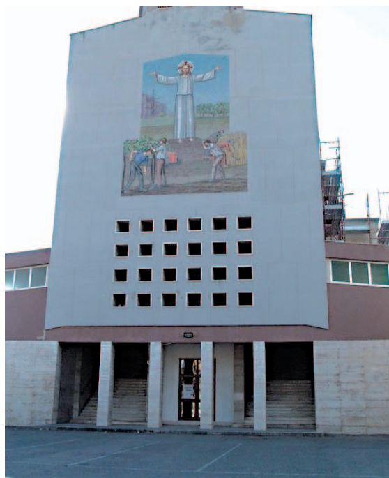
La chiesa di Cristo lavoratore a Trinitapoli