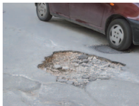
Trani, asfalto dissestato in via Bachelet