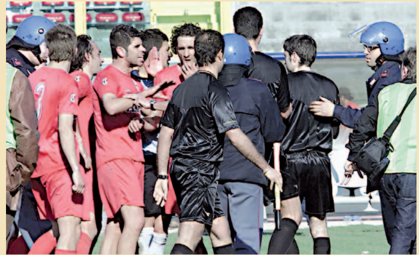
Barletta, la terna arbitrale esce dal terreno di via Vittorio Veneto scortata dalla Polizia

Un giovane tifoso barlettano, durante i disordini, è stato bloccato dagli stessi poliziotti e portato in commissariato. Il tifoso barlettano (del quale non sono state rese note le generalità) sarebbe stato accusato di aver preso parte attivamente ai disordini post partita e, per questo, dopo le formalità di rito, è stato arrestato e trasferito nel carcere di Trani. [Gian.Bals.]